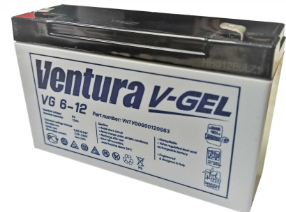
Габаритні розміри, мм