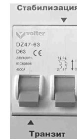
Рис. 6 Отключены оба режима.