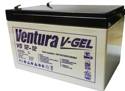
Габаритні розміри, мм