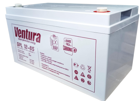
Габаритні розміри, мм